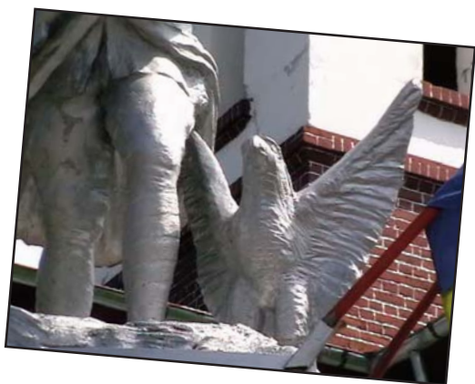
Monumentul Eroilor de la Pietrarii de Sus. Reconstituirea vulturului, aluminiu, 2005

coperta 4: Sf. Dumitru (Cel Nou), pictură lemn, 2004, 50 x 25 cm