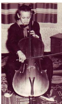
1962 Bizu și violoncelul.