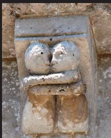
Grup statuar în Biserica Saint-Pierre d'Aulnay 1120-1140 .....

Coperta 1: „Ciobul dacic”, colecția „Gheorghe Petre Govora” din muzeul cu același nume din orașul Băile Govora.