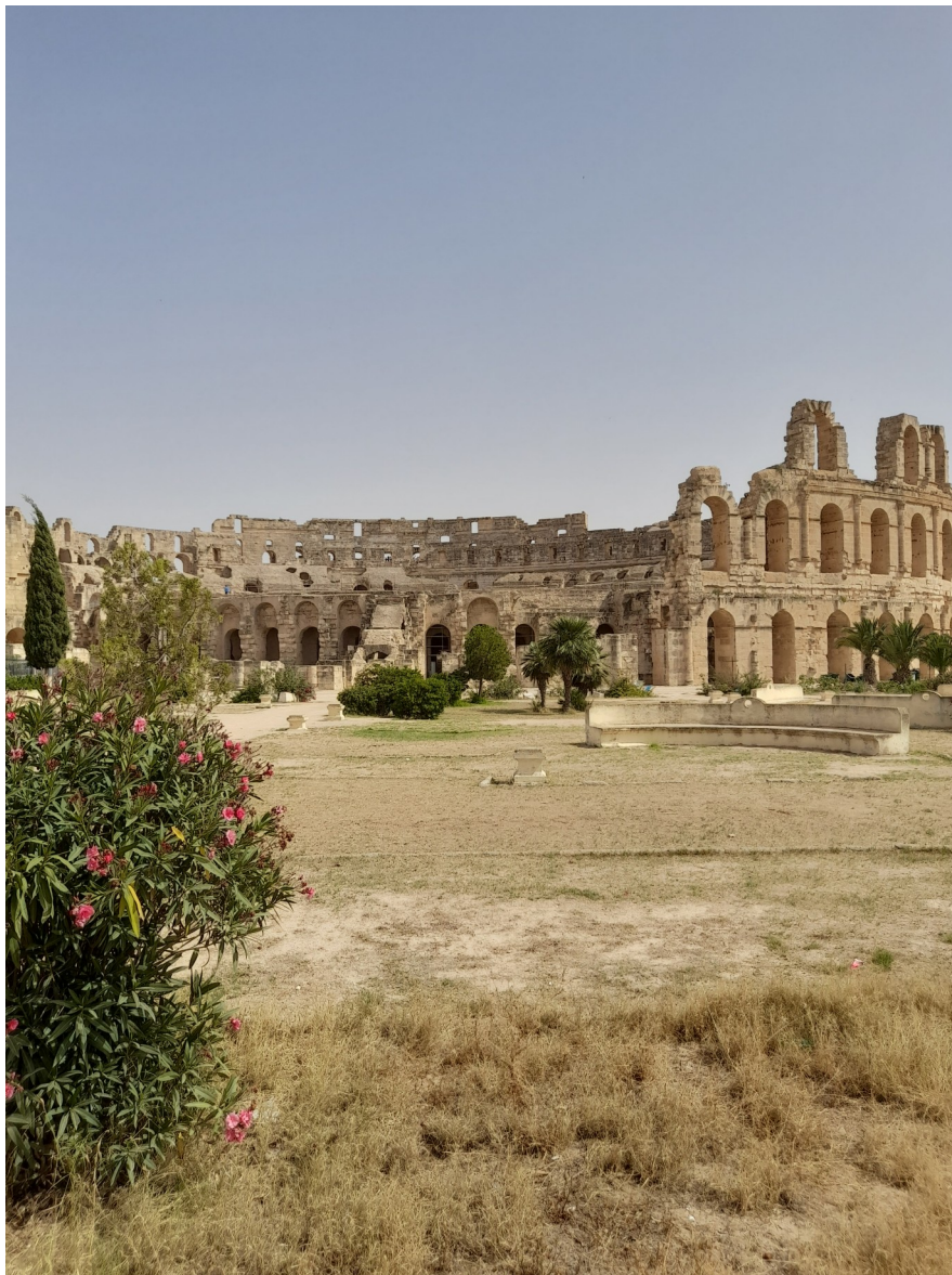
Cu Seniorii la colosalul „stadion” al antichităţii de la El Gem/Tunisia